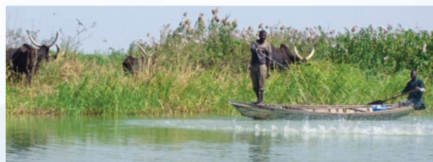
Pêcheur sur le lac Tchad

Depuis 1960, la surface du lac Tchad a diminué de 30.000 km 2 à environ 2.500 km 2 . Les variations climatiques, la forte croissance démographique dans la région, la construction de barrages, l'implantation de grands projets d'irrigation dans le bassin versant et l'exploitation à grande échelle des eaux souterraines ont contribué à cette réduction considérable de l'étendue du lac.