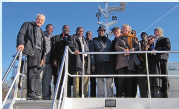
Visite de la Commission internationale pour la protection du Danube, du Rhin et du lac de Constance dans le cadre des activités de renforcement des capacités, de sensibilisation et de transfert de connaissances (février 2012)